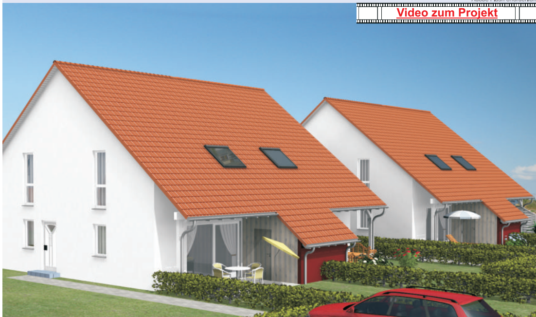
WE 2 Grundstückgröße 273 m 2 WE 3 Grundstückgröße 273 m 2 WE 4 Grundstückgröße 450 m 2